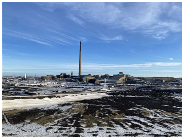
Hudbay 社の既存選鉱設備