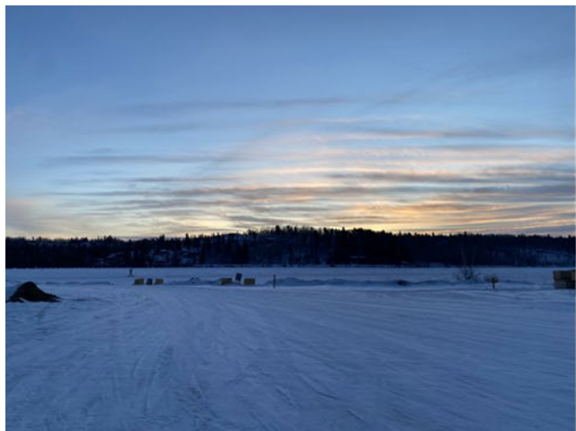
フリントロン地域の地表状況