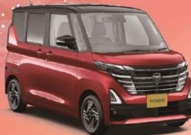
NEW ルークス ハイウェイスター-X プロパイロットエディション 660 エクストロニックCVT BR06-SM21 2WD 標準地仕様

Photo ハイウェイスター-Xプロ パイロットエディション(2WD),ボ ディカラーはスパークリングレッド (PM)/ブラック(P)2トーン(特別 塗装色95,000円高),内装色は ブラック(G).