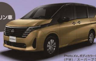
セレナ XV 4WD