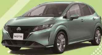
ノート e-POWER X