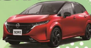
ノートオーラ G leather edition