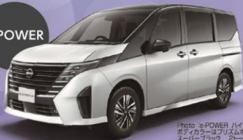
NEW セレナ e-POWER ハイウェイスターV

HR14DDe-EM57 2WD 標準地仕様 アラウンドモニター+ドラレコ+ LEDヘッドライト+ETC2.0+SOSコール(メーカーオプション488,400円付き)