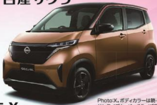
サクラ X MM48 2WD 標準地仕様

Photo X, ボディカラーは影アガツキ サンライズカラー(M)/ブラック(P)2 トーン(#XJD)(特別塗装色93,500 円高),内装色はベージュ(K).