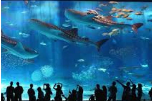
しながわ水族館 写真1