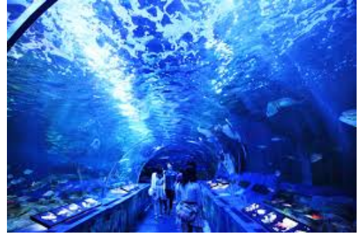
しながわ水族館 写真2