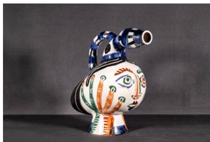
Pablo Picasso Canard pique-fleurs , 1951 white earthenware, thrown, elements attached; dipped in a white glaze, decorated with colored slips and oxides, sgraffito, 39X48 cm.