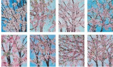
Damien Hirst The Virtues (H9) , 2021 Estimate: HK$600,000-800,000/ US$77,100-103,000

フィリップスは、マルチプル（エディション）作品の取り扱いで世界の市場をリードしています。3月28日には、アジアのコレクター間で高まる版画やエディション作品への関心を背景に、アジアで初となる、エディション作品に特化した ライブオークション を香港にて開催いたします。サルバドール・ダリ、ダミアン・ハースト、KAWS、バンクシー、奈良美智など、近現代美術界を代表するアーティストの作品を集め紹介いたします。中でも、ダミアン・ハーストの The Virtues (H9) は、日本の武士道にインスパイアされた作品とされ、オークションのハイライトとして注目を集めています。