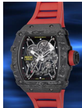
Richard Mille RM35-02 Rafael Nadal Carbon TPT skeletonized wristwatch Estimate: HK$1,000,000 - 2,000,000/ US$120,000 - 240,000