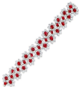
Ruby and Diamond Bracelet, rubies totalling 33.66 carats Estimate: HK$4,700,000 - 6,700,000/ US$600,000 - 860,000