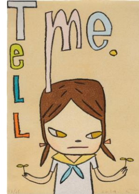
Yoshitomo Nara Tell Me , 2014 Estimate: HK$220,000-320,000/ US$28,300- 41,200