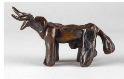
Pablo Picasso Taureau , 1957 Bronze, 9x16.5x6.4 cm Edition of 2