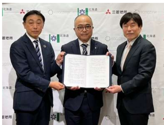
三菱地所(株)、(一社)大丸有環境共生型まちづくり推進協会との協定締結

このほかにも、包括連携協定の中ではワーケーション推進に関する項目を締結している企業が4社あり、連携しながら北海道型ワーケーションを推進しています。