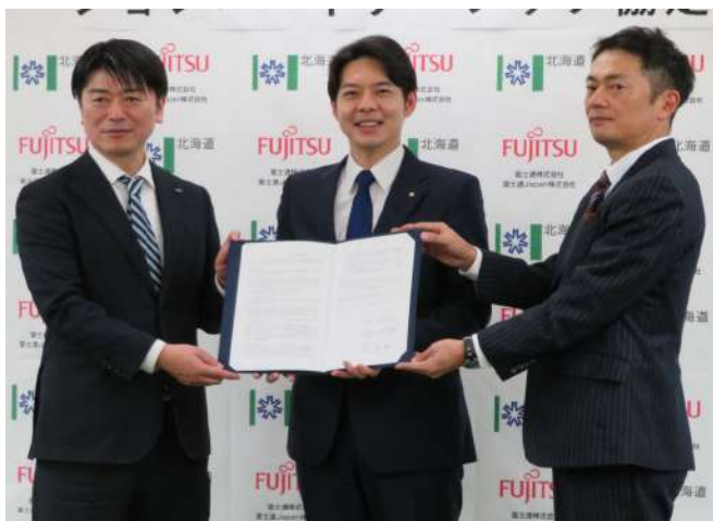
富士通(株)、富士通Japan(株)との協定締結