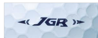
《サイドマーク (ホワイト) 》