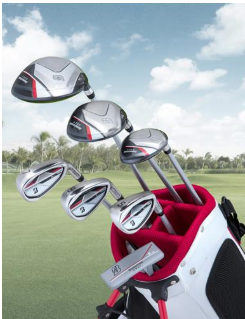
B-Jr シリーズ (Type150)

『B-Jr シリーズ』は、ユニセックスなクラブデザインで、ボールを真ん中に構えられるアライメントデザインや、正しいアドレス姿勢をサポートするソール形状、成長に合わせて握りやすい設計のグリップなど、ジュニアゴルファーの成長に寄り添った機能を搭載しています。商品は、身長で選べる 2 タイプ（Type130/Type150）のクラブとキャディバッグをラインアップしています。