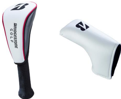
・クラブ・ヘッドカバー (中国製)

本件に関するお問い合わせ先 < 報道関係 > ブランド・ファンコミュニケーション部 pr.bsp@bridgestone.com < お客様 > お客様コールセンター 0120-116613