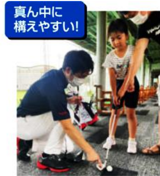
ジュニアゴルファーの評価でも「真ん中に構えやすい」と高評価

ボールを真ん中にセットしやすいように、スコアラインの最下線をボールの大きさに合わせたデザイン（パターはブレード部にラインを配置）