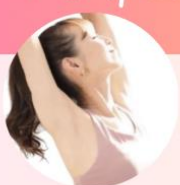
さやピラ ぽっこりお腹改善 ピラティス