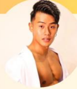
よっくん 爆痩せHIITトレーニング