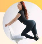
SATORI 美尻トレーニング