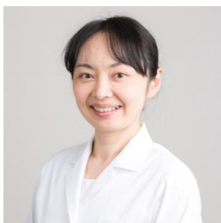
クリアージュ東京 レディースドッククリニック 婦人科顧問 大島乃里子医師

今回の調査結果で挙げられた「膣の乾燥」について、乾燥が起こる原因や対策法をクリアージュ東京 レディースドッククリニックの婦人科顧問の大島乃里子医師に伺いました。