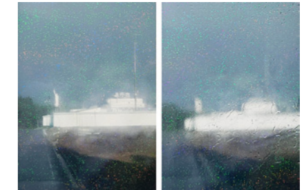
「外が静かになるまで」/ 2023 デザイン: 石塚俊

写真家 / 舞台作家。福岡県生まれ。周縁化された場所やものに残る記憶や風景を繋ぎ、それらの中間項を見つめ前置化させることをテーマに研究と実践を行う。写真・映像を元にフィクションを作り、メディアを通して領域横断的に活動する。近年の主な展覧会に『外が静かになるまで』(十和田市現代美術館 space他) など。