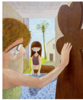
850×100mm / キーリング / 2022 Your heartbeat!

1994年大阪府生まれ。2020年京都市立芸術大学大学院美術研究科修士課程絵画専攻修了。「まなざし」を大切にしながら、別の世界へ広がる可能性を秘めたモチーフとともに絵画を描く。画面からは多層的な空間の広がりや時間の重なりなどが感じられる。