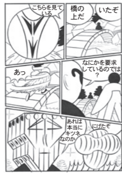
250×340mm / 紙、ペン / 2022 高橋健一「ハイ・イン・ターナル」

美術家、マンガ家。1967年宮崎県生まれ。武蔵野美術大学油絵科卒業。ファインアートの制作を行っていたが、2000年以降「時間が表現できる」とマンガを発表。後に「ネオ漫画」と称される独創的な作品は、様々な分野で高い評価を得る。現在は、現代アーティストとしても活躍。 協力 | バイ インターナショナル「ネオ万葉」