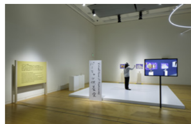
「バーチャル供養講」 サイズ可変 / VR体験を含むインスタレーション、ヘッドマウントディスプレイ、舞台、ペーパークラフト、カーペット、モニター、おりん / 2021

情報科学芸術大学院大学(IAMAS)修士課程修了。アーティスト、リサーチャー。自身をポスト・インターネット時代のBenderと称する。AmazonやYouTubeなどのサービスも活動の場として取り込みながら、規範的な価値観や物語に問いを投げかける。近年は民話や信仰のリサーチをもとに、現代における物語の流通や記憶の共有のあり方について制作している。