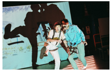
「バナナの花は食べられる」/ KAAT神奈川芸術劇場 / 2023

演劇集団範宙遊泳代表。幼少期から吸収した映画・文学・音楽・美術などを芸術的素養に、加速度的に倫理観が変貌する現代情報社会をビビッドに反映した劇世界を構築。アジア諸国や北米での公演や国際共同制作も多数。『バナナの花は食べられる』で第66回岸田國士戯曲賞を受賞。公益財団法人セゾン文化財団フェロー。