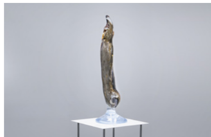
「Physis」 サイズ可変 / 樹脂、木(杉) / 2023

1985年北海道生まれ。モノやイメージ、個や社会に内在する自明ではないものや逃れられないものとの関係性について考察し、多分野にまたがるアプローチを写真・映像・彫刻・インスタレーションなどのメディアに反映させている。東京、ロンドンでの活動を経て、現在は札幌を拠点に活動。