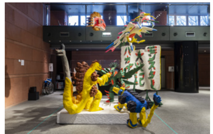
「モンスター大戦記ハカイオウ」 サイズ可変 / 粘土、兄の絵、兄との会話、テキスト / 2023

1994年東京都生まれ。東京造形大学彫刻専攻卒業。東京藝術大学大学院美術教育研究室修了。現在は独自の体験を基に物語をつくり、粘土のオブジェ・インスタレーションを主に制作。ものをつくること、そこに他人が関わること、そしてその場に生じる言語領域からはみ出したコミュニケーションを大切にしている。