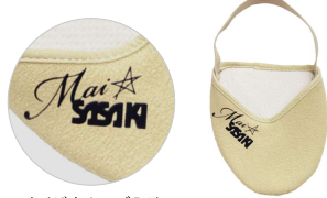
オリジナルロゴ入り