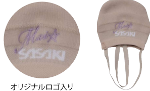
オリジナルロゴ入り

体操選手の必須アイテム。 多くの選手に選ばれる人気のデミシューズ。 フィットする履き心地で、理想のターンに近づく。 マイコレロゴが目を引くポイントに★