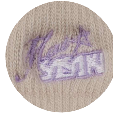
オリジナルロゴ入り

プロテクターとの一体感を追求したつけ心地。 多くの声から生まれた、動きやすい薄手設計。 快適なフィット感で手首をやさしく守ります。