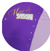
ラインストーン付き