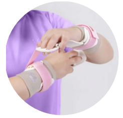
プロテクターとの 相性抜群!!