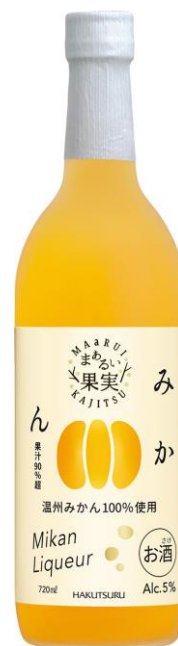
白鶴 まあるい果実 みかん 720ml