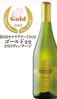
ミシオネス レセルバ シャルドネ 【味のタイプ】白 / やや辛口 【価格】オープン価格