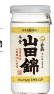
上撰 白鶴 サケカップ 山田錦