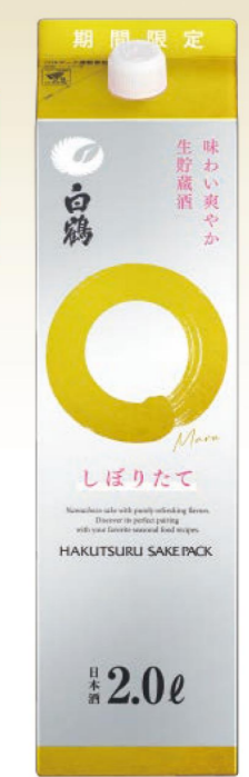
白鶴 サケパック まるしぼりたて