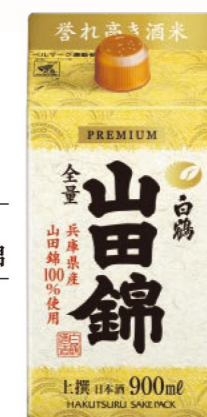
上撰 白鶴 サケパック 山田錦