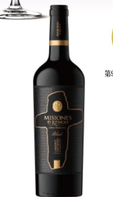
ミシオネス グランレセルバ カベルネ・ソーヴィニオン 【味のタイプ】赤 / フルボディ 【価格】12,500円