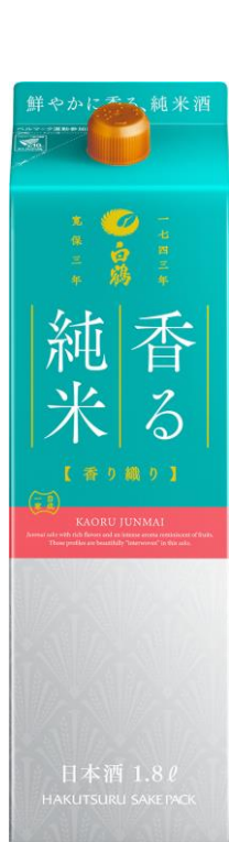
白鶴 サケパック 香る純米 香り織り 1.8L