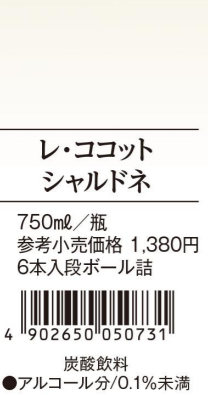
レ・ココット シャルドネ