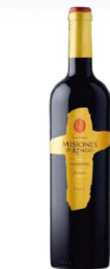
ミシオネス レセルバ カルメネール 【味のタイプ】赤 / ミディアムボディ 【価格】オープン価格