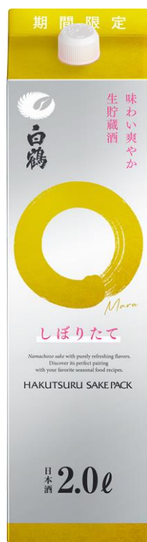
白鶴 サケパック まる しぼりたて 2.0L