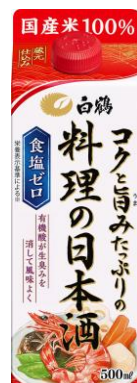
白鶴 ／ 500ml