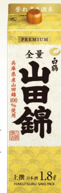
上撰 白鶴 サケパック 山田錦