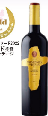
ミシオネス レセルバ カベルネ・ソーヴィニオン 【味のタイプ】赤 / ミディアムボディ 【価格】オープン価格