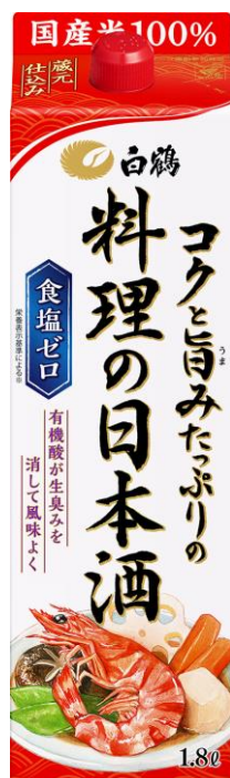
白鶴 コクと旨みたっぷりの料理の日本酒 1.8L