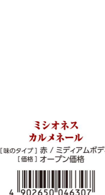
ミシオネス カルメネール 【味のタイプ】赤 / ミディアムボディ 【価格】オープン価格