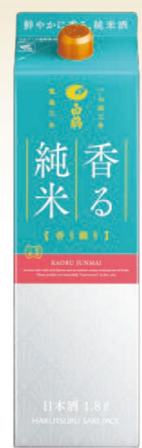
白鶴 サケパック 香る純米 香り織り