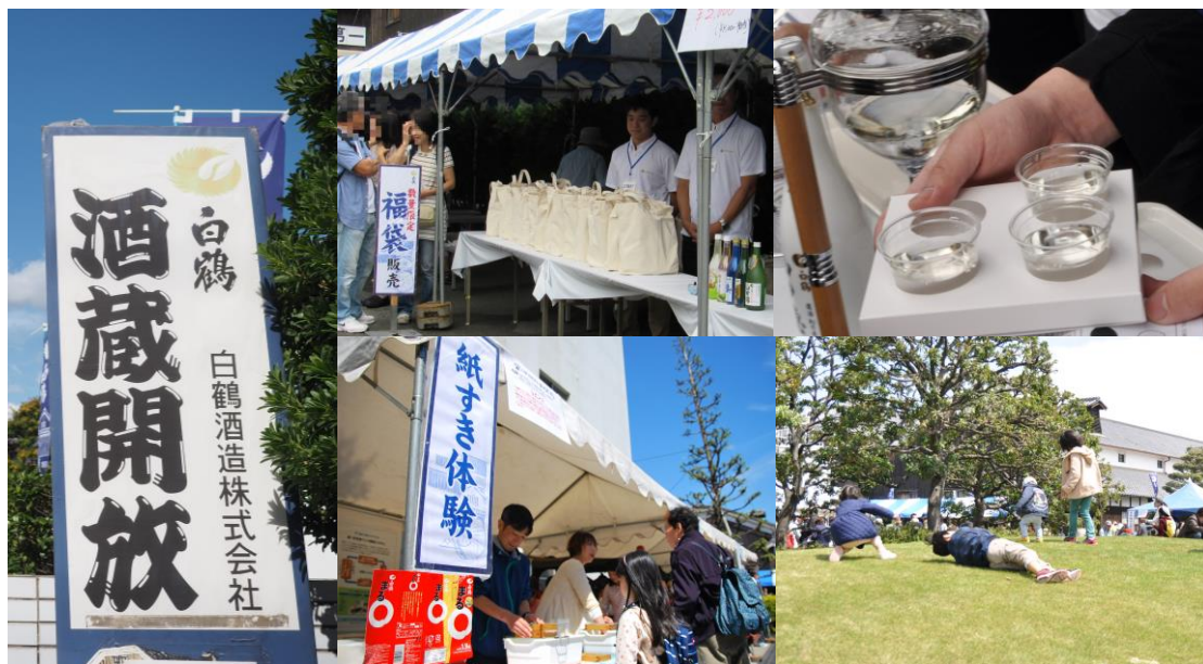
▲過去の酒蔵開放の様子

白鶴酒造株式会社は、地域貢献と日本酒の需要開発、白鶴ブランドのPRを目的として2023年4月15日(土)に3年半ぶりとなる「白鶴2023年春『酒蔵開放』」を開催します。