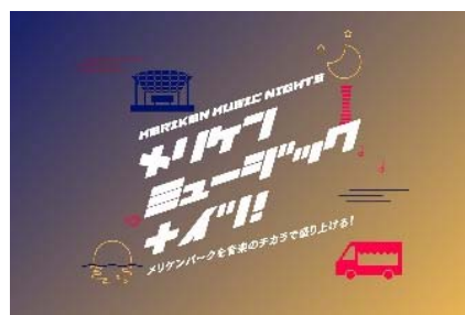
メリケンクリスマスに関する画像は神戸市提供