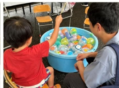
過去の酒蔵開放のようす