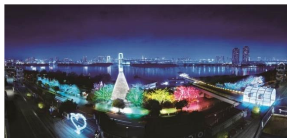
「お台場イルミネーション“YAKEI”」全体イメージ(中央が樹木イルミネーション)

デックス東京ビーチの通年点灯型イルミネーション「お台場イルミネーション“YAKEI”」が、「お台場イルミネーション“YAKEI”～映画『散歩する侵略者』Ver. ～」として、映画予告編の音声に合わせて「切ない愛の物語」を表現して点灯する演出を期間限定で実施します。