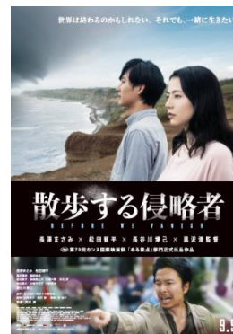
「映画『散歩する侵略者』メインビジュアル」

デックス東京ビーチはご家族連れ、カップル、観光客など多くの方にご来館いただき「大事な人と大切な時間を過ごす場」としてご利用いただいています。「世界は終わるのかもしれない。それでも、一緒に生きたい。」と謳う本映画作品のテーマと一致することからタイアップキャンペーンが決定しました。