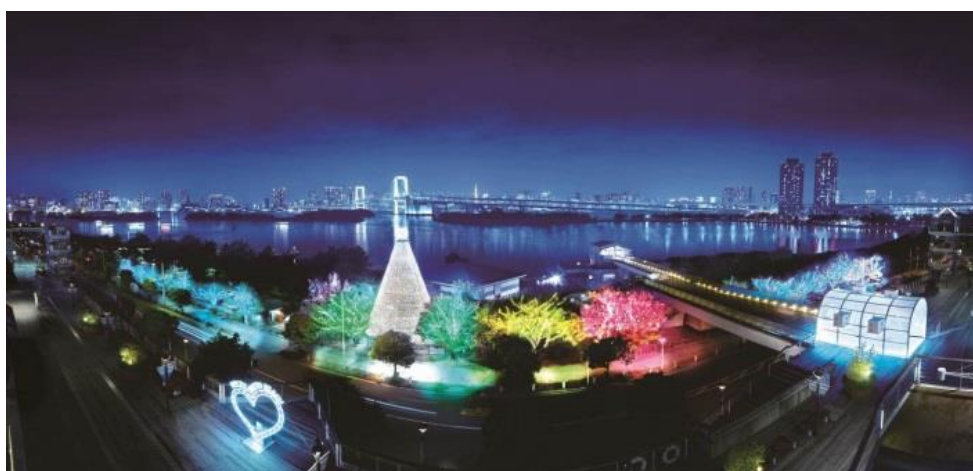
「お台場イルミネーション“YAKEI”」全体イメージ(中央が樹木イルミネーション)(イメージ)

高さ約20メートルの「台場メモリアルツリー」を中心にした全長約200メートルに渡る「樹木イルミネーション」は、約22万球の光が期間中にしか見られない演出で優しく染まります。