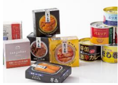
お酒のおつまみにもぴったりな缶詰めが250種類!

キッチンに立つのが楽しくなるような調味料、乾物、日本酒、焼酎、お菓子など、こだわりの美味しいものを取り揃えたグロッサリーのエリア。