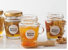
「はな房(はちみつ) ナッツとドライフルーツ入りはキッチン&マーケット限定!