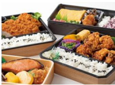
ランチタイムには数量限定でお得な500円弁当も販売!