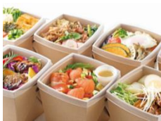
毎日、利用しても飽きないバラエティ豊かなお弁当を展開