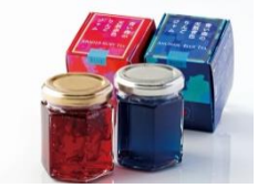
「青い森の天然赤色りんごジャム」「青い森の天然青色りんごジャム」95g 各840円