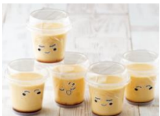
「ご褒美プリン」1個 195円