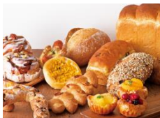
食事系からデザート系パンまで幅広い品揃え