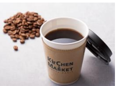
「キチマオリジナルブレンドコーヒー」216円