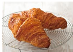
「ドゥーブル クロワッサン」1個 216円