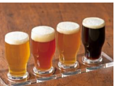
「地ビール飲み比べセット」1,080円