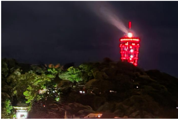
江の島シーキャンドル