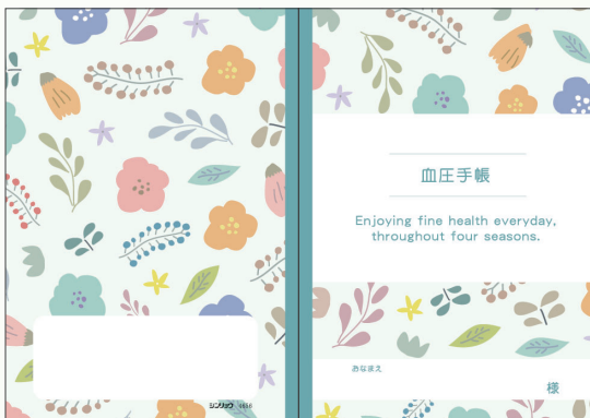
4656 北欧グリーン(数値式)