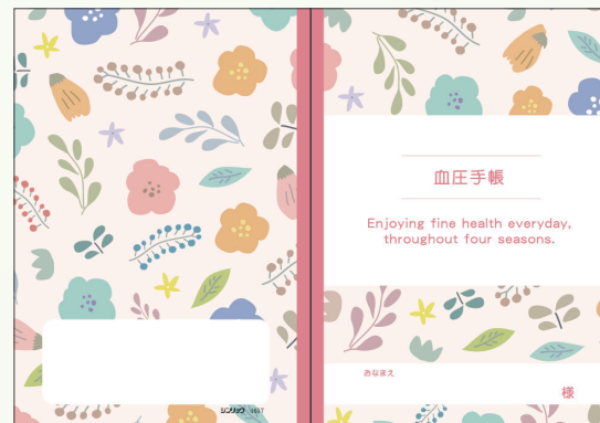
4657 北欧ピンク(グラフ式)