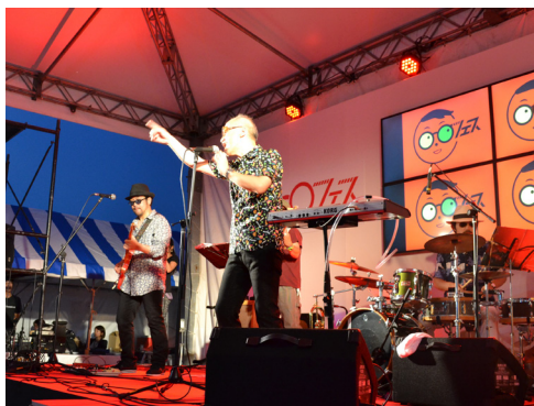
JB ORGA BAND(9日めがねナイト)