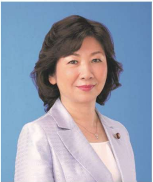
野田 聖子 衆議院議員