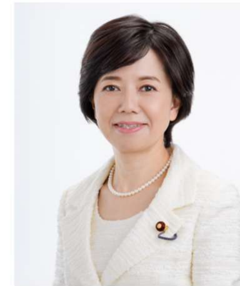
鰐淵 洋子 衆議院議員