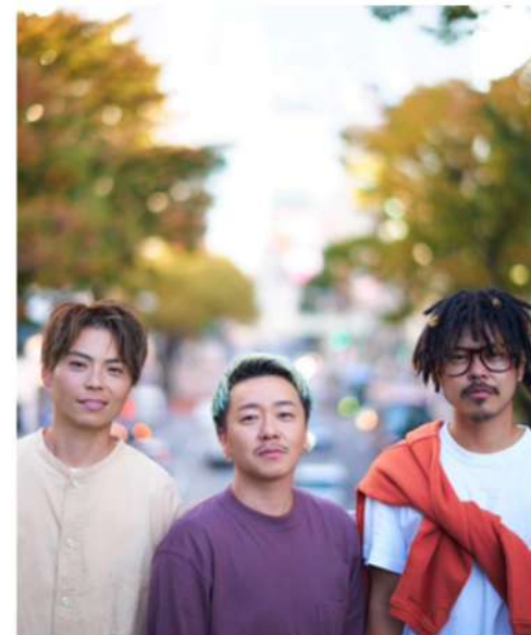
ミュータントウェーブ ジェンダリスト 元なでしこ女子サッカー選手