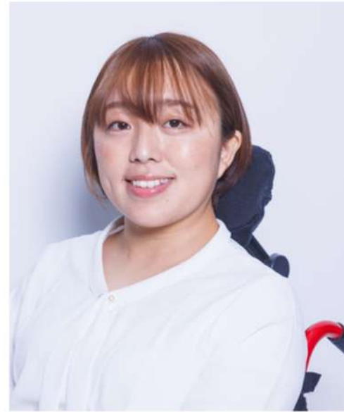
鬼谷 慶子 パリ・パラリンピック 陸上女子円盤投げ 銀メダリスト 東京エネシス所属