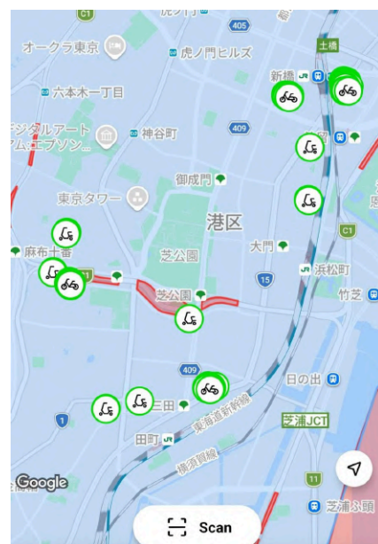
▲Limeアプリ画面 アプリ上で車両の現在地が確認可能