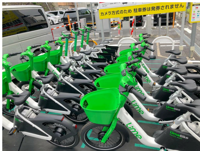
▲ポート現地写真(左:押上1丁目バイク駐車場、右:RBパークテレビ朝日前)