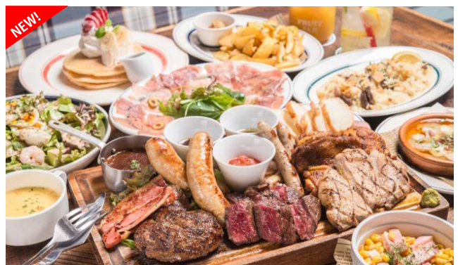
より美味しくなったフォトジェ肉なメニューがラインナップ!

豊富なメニューの中でも、フォトジェ肉なメニュー達はインスタグラムで大人気! 『極太ソーセージ』はじめ新メニュー『熟成牛の生ハムアボカドユッケ』など、お酒との相性抜群のメニューが増えました。骨ごとじっくりと丁寧に焼き上げ、肉の旨みを最大限に引き出した骨付き『トマホークステーキ』、総重量1kg/全10種の名物肉盛り『NICK VILLAGE』など、圧倒的"フォトジェ肉"な料理を囲んで一味違ったディナーをお楽しみいただけます。定番/人気メニューを厳選したコースメニューも一新し、お一人様から大人数でのパーティーまで幅広い用途でご利用いただけます。