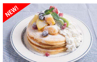
フルーツミックスパンケーキ

NICK STOCK 自慢のパンケーキやスイーツをこだわりドリンクとともに、カフェタイム限定でお得なセットメニューとして楽しめます。今回新たにフレッシュフルーツを使用した全6種のスムージーが新登場! 昼下がりにママ会でもご友人とでも落ち着いたカフェ空間をお楽しみください。