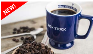
コーヒーはリーズナブルに!

ボリュームとバランスを考えたNICK STOCKの極上モーニングは、選べるフードとサラダ・ドリンクがついて500円〜お楽しみ頂けます。定番トースト or 名物極太ホットドッグ、全7種のラインナップを揃えました。また、コーヒーが280円(+税)と、より美味しくよりリーズナブルに!