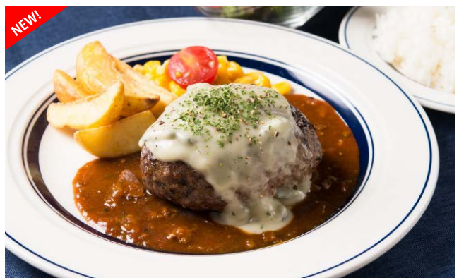
熟成牛ゴルゴンゾーラチーズハンバーグランチ 1,580円