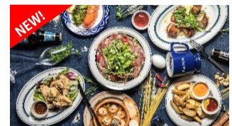
豊富になったバルメニュー!