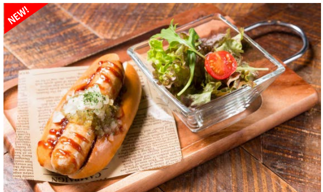
極太ホットドッグモーニング 780円