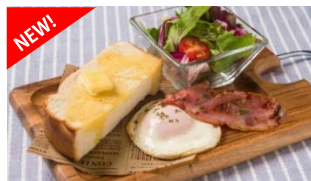
厚切りトーストセット