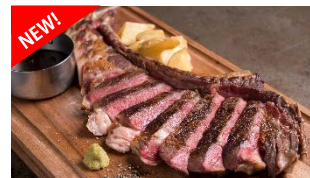
骨付き熟成トマホークステーキ