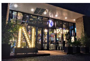
【東京】トリエ京王調布店