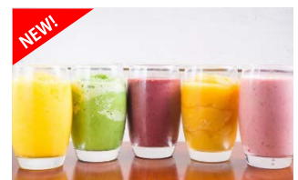
フレッシュスムージー