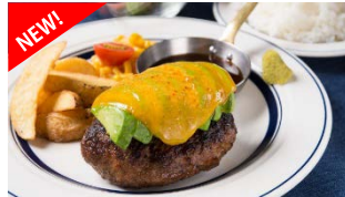
熟成牛アボカドチーズハンバーグ