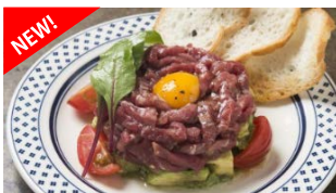
熟成牛の生ハムアボカドユッケ