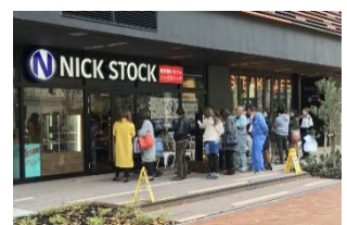
11/25 OPEN! 【愛知】豊田市駅前店