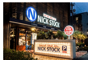
【京都】京都リサーチパーク店

2016年1月に1号店を京都市内にオープン。コンセプトは、『肉が旨いカフェ』。オープン当初より「カフェらしからぬ」圧巻のクオリティとフォトジェニックな肉料理が注目を集め、メディアで話題に。また、「朝・昼・カフェタイム・夜」と、時間帯ごとに異なるメニューを提供することから“4毛作カフェ”として、そのビジネスモデルにも注目が集まっている。