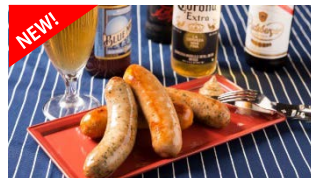
4種の自家製極太ソーセージ