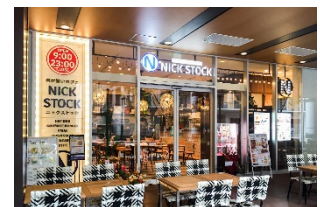
【京都】イオンモール KYOTO 店