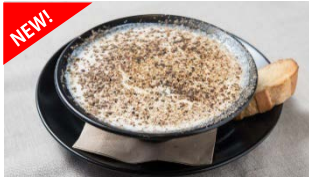
ブラックカルボナーラ (パスタ)

目玉はもちろん、手ごねにこだわった『熟成牛ハンバーグ』。新メニューではハンバーグランチの種類が全10種類に増え、トッピングも9種類と豊富にラインナップ。他にもステーキやハンバーガー、パスタなどデイリーに使える20種以上の豊富なメニューを揃えました。