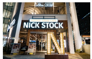
【愛知】名古屋駅前店