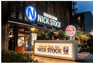
【京都】京都リサーチパーク店

・モーニング : 500~800 円 (+税) ・ランチ : 780~1,200 円 (+税) ・カフェタイム : 500~1,200 円 (+税) ・ディナー : 1500~3,500 円 (+税) ※コーヒー : ALL TIME 280 円 (+税)