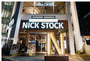
【愛知】名古屋駅前店