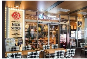
【京都】イオンモール KYOTO 店