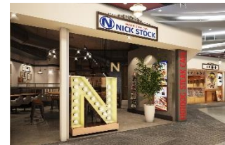
【神奈川初出店】横浜ポルタ店 2018年1月20日(土) OPEN