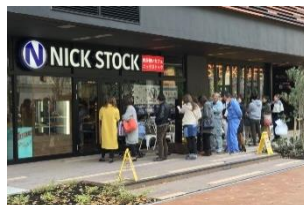
【愛知】豊田市駅前店