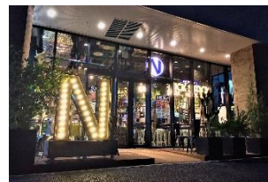
【東京】トリエ京王調布店