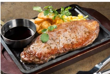
「サーロインステーキ」：1,880円（+税）