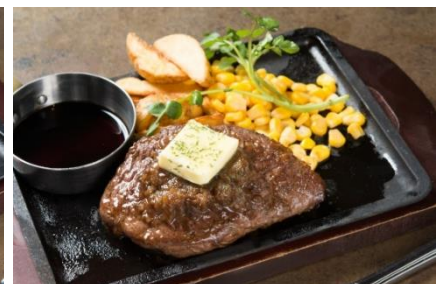
「シャリアビンスステーキ」：1,980円（+税）