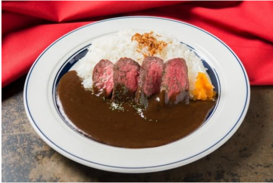
「ステーキカレーライス」:1,580円 (+税)

ステーキ、ハンバーグはもちろん、贅沢にステーキをのせた「ステーキ屋のステーキカレーライス」が登場!じっくり時間をかけて煮込み、とけだした野菜の甘味とスパイスが効いた逸品です。しっとり柔らかいミディアムレアのステーキとカレーとの相性は抜群!また、「お子様ランチ」や小学生限定の「学生ハンバーグステーキ」など、子どもや家族連れにも本格料理をお得にお楽しみ頂けるメニューをラインナップ致しました。