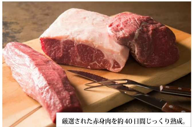
厳選された赤身肉を約40日間じっくり熟成。

また、毎日手ごねにこだわり肉汁がジュワッと溶け出す「熟成牛ハンバーグ」など、様々な本格肉料理をお楽しみ頂けます。