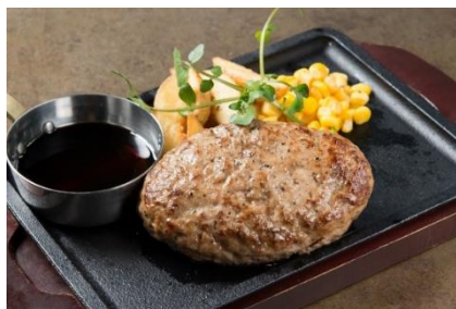
「熟成牛ハンバーグ」：980円（+税）