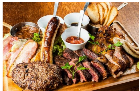
インスタ映えもバッチリ！「ニックビレッジ」：6,980円（+税）

ステーキ/ハンバーグ/ポークソテー/タンドリーチキン/極太ソーセージ/バジルソーセージ/厚切りベーコン/生ハム/ローストビーフ/ハッシュドビーフ