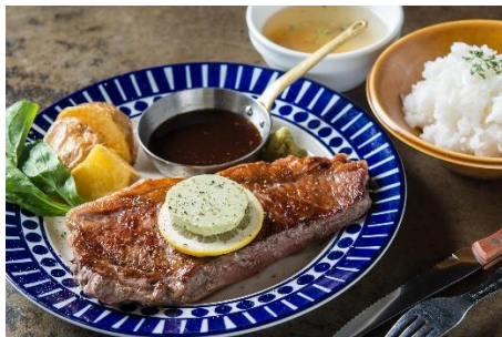
「サーロインステーキランチ」：1,780円（+税） ※ライス・サラダ・スープ付

ランチタイムは、肉汁がジュワッと溶け出す「熟成牛ハンバーグ」や「ステーキランチ」など、本格肉料理をお得にご提供致します。お肉×チーズの濃厚な味わいがクセになる「肉屋のカルボナーラ」や、じっくり煮込み肉の旨みが溶け出した「超熟牛肉カレーライス」など豊富なラインナップをご用意。他にも「お子様ランチ」やなど、子どもや家族連れにも本格料理をお得にお楽しみ頂けます。