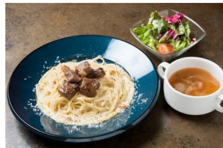
「肉屋のカルボナーラ」：1,280円（+税） ※サラダ・スープ付