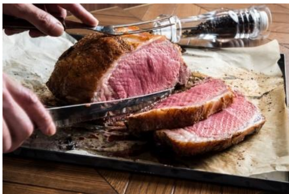
「出来立て、切り立て」の美味しさをダイレクトに体験。

『塊のまま焼き上げ、じっくりと火入れし、出来立てのうちに食す。』それが、私たちが考える最も贅沢な肉の食し方。「The NICK STOCK」が誇る『プレミアム・ローストビーフ』は、塊肉を低温でじっくり焼くことで、柔らかく肉の旨みがギュッと濃縮された絶品名物料理です。出来立て、切り立てのローストビーフを口の中にはおぼる贅沢な体験をお楽しみください