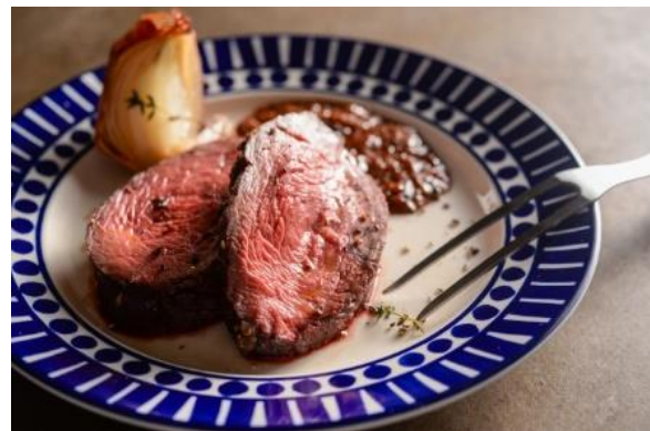
「プレミアム・ローストビーフ」： 200g 1,980円（+税）～