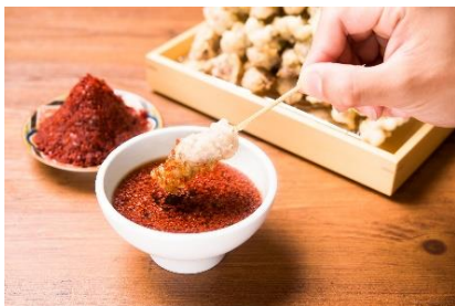
看板メニュー「勝天串」

勝天は、王道の和食をカジュアルに楽しんでいただける「天ぷら PUB」。特徴は、天ぷら一つ/寿司一貫/日本酒半合/ビールはハーフポイントからご注文可能。中でも、肉の旨みが詰まった「肉天ぷら」は勝天の名物メニュー。天ぷらにすることで、肉の旨みをギュッと閉じ込めジューシーさが増した『新感覚の肉の旨み』を堪能頂けます。黒毛和牛のステーキ天、珍しい上ミノ天や豚バラ一本天など…豊富な種類の肉天をお楽しみ頂けます。肉天ぷらだけでなく「天ぷら・寿司/刺身・炉端焼き」などの王道の和食、料理に合う地酒や日本酒、ワインなど100種類以上のドリンクをラインナップ。「揚げたて/焼き立て/切り立て」を、少しずつ好きな量だけ召し上がっていただけます。