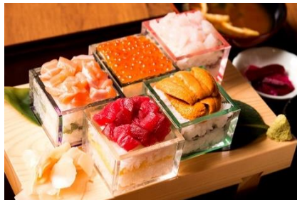
升寿司 5 段：1,980 円（+税）