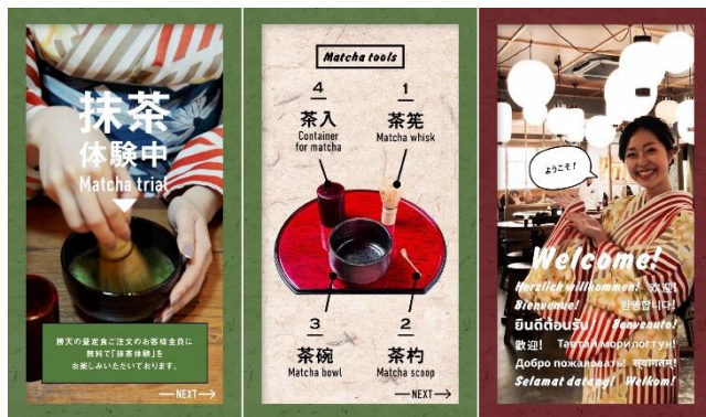
各 SNS で案内・動画配信中！

さらに、外国人観光客が不満に感じている「コミュニケーションがとれない」という課題について、「動画」「SNS」を駆使したコミュニケーションを積極的に導入しております。勝天では外国人観光客の方にもわかりやすいように、メニュー紹介やこだわり、食べ方、アクセス方法などを、動画を使って積極的にSNSや店内で紹介する等、安心してご来店頂ける取り組みを進めております。