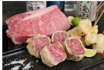
これぞ贅沢！「黒毛和牛の天ぷら」