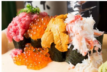
SNS で大人気「こぼれのつけ寿司」