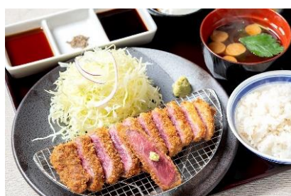
「牛ロースカツ膳」並 1,480円（+税）