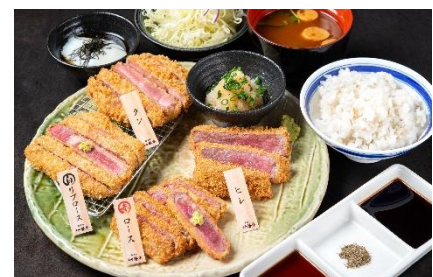
牛カツ欲張り御膳 2,780円（+税）