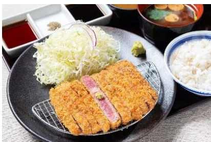
「牛リブローズカツ膳」並 1,380円（+税）

選べる種類は、「リブローズ」「ロース（ハネシタ）」「タン」「ヒレ」「黒毛和牛（ウチモモ）」の全5種類。4種類の部位を食べ比べでき、ボリュームもある「牛カツ欲張り御膳」は、老若男女問わず好評いただいております。豊富な部位に加え、バラエティ豊かな薬味とつけだれをご用意。こだわりの和風だしをたっぷり効かせただし醤油や特製和風カレーつけ汁、野菜の旨味が溶け込んだ牛カツソース、山椒塩など、牛カツとの相性にこだわり抜いたたれ・薬味から、自分好みの組合せを愉しんでお召し上がりいただけます。