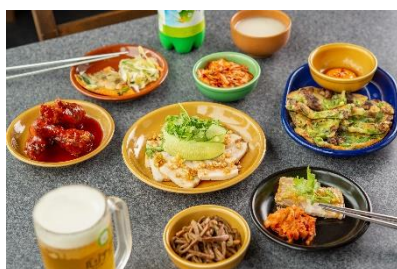
手仕込みにこだわった一品料理が充実!

ピリっと甘辛い「ヤンニョムチキン」や1人用鍋「スンドゥブチゲ」など、手仕込みにこだわった本格的な一品メニューを充実させ、サムギョプサルだけでなく韓国料理とお酒だけで楽しめるようになりました。ドリンクにもこだわり、「飲む美容液」とも呼ばれる生マッコリを使用したオリジナルドリンク「マッコリカクテル」は、ほんのりした甘さと酸味、微発砲でスッキリした味わいはサムギョプサルとの相性抜群の一杯。マッコリ初心者の方にもオススメです。