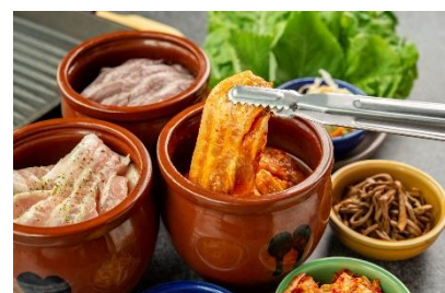
旨味が詰まった壺漬けサムギョプサル