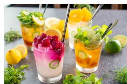
フルーツたっぷりカラフルな見た目も可愛い!