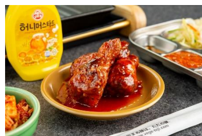
話題の「ヤンニョムチキン」は本場の味