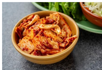
お酒のお供にもおすすめの「生キムチ」