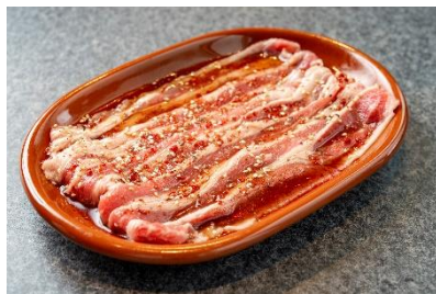
「ウサムギョプ」はさっぱりとした旨ダレで

新名物は、牛肉のサムギョプサル「ウサムギョプ」。特製の旨ダレがあっさりとしていて何度でも口に運びたくなる美味しさです。他にも、王道からハーブ・ワインのつぼ漬けサムギョプサルなど個性豊かなメニューをラインナップ。もう一つの新名物は、サムギョプサル専門店では珍しいベジテジやオリジナルの「生キムチ」。生キムチは韓国語でコッチョリと呼び、フレッシュな白菜を提供直前に特製の薬念(ヤンニョム)でさっと和えたサラダ感覚の新感覚キムチです。漬けたキムチをトッピングするのが一般的ですが、お肉だけでなく野菜にもこだわるベジテジやならではの、フレッシュでシャキシャキとした生キムチを包むことで新感覚のサムギョプサルをお楽しみ頂けます。