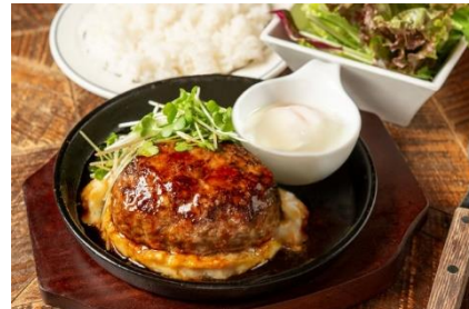
熟成牛ハンバーグ(照り焼き+温泉玉子)