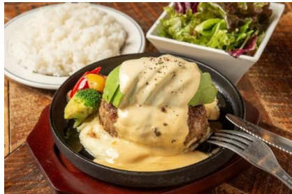
熟成牛ハンバーグ組み合わせ例(アボカド+チーズ)