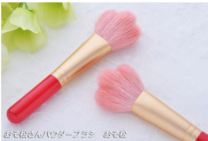
おそ松さんパウダーブラシ おそ松