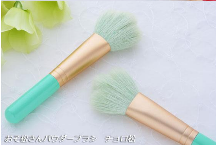
おそ松さんパウダーブラシ チョロ松