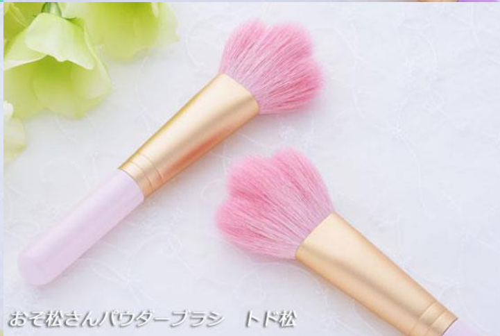
おそ松さんパウダーブラシ トド松