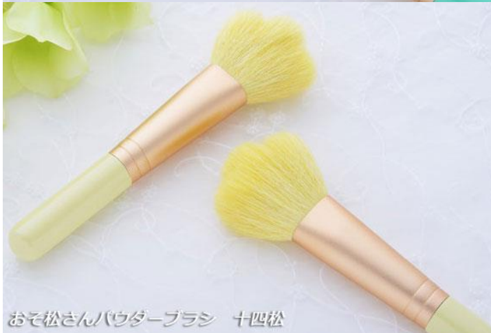
おそ松さんパウダーブラシ 十四松