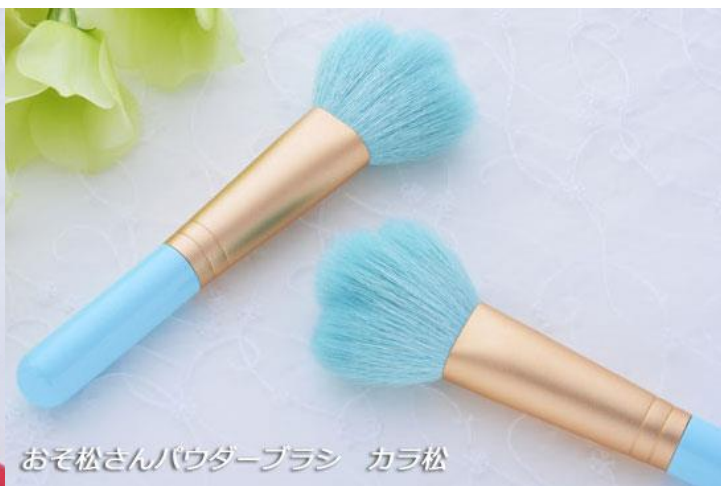
おそ松さんパウダーブラシ カラス松