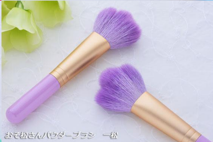
おそ松さんパウダーブラシ 一松