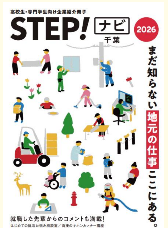
STEP！ナビ千葉 創刊号表紙

千葉女子専門学校、中央介護福祉専門学校、千葉調理師専門学校、千葉情報経理専門学校、国際医療福祉専門学校、国際トラベル・ホテル・ブライダル専門学校、専門学校ちば愛犬動物フラー学園、東洋理容美容専門学校千葉校、千葉モードビジネス専門学校、専門学校国際理工カレッジ、関東鍼灸専門学校、パル総合美容専門学校千葉校、山王看護専門学校、千葉美容専門学校、千葉県自動車大学校、イーストウエスト外国語専門学校、千葉日建工科専門学校、上野法科ビジネス専門学校、京葉介護福祉専門学校、東京IT会計公務員専門学校千葉校、ジェイヘアメイク美容専門学校、千葉デザイナー学院、千葉市青葉看護専門学校、千葉医療秘書&IT専門学校、千葉リゾート&スポーツ専門学校、千葉ビューティ&ブライダル専門学校、大原簿記公務員専門学校千葉校、大原医療保育福祉専門学校千葉校、ハッピー製菓調理専門学校、アイエステティック専門学校、千葉子ども専門学校、北原学院千葉歯科衛生専門学校 ほか