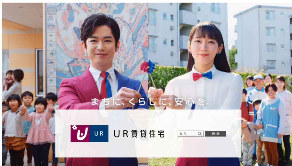
新TV-CM「くらしを咲かせる」篇より

https://www.ur-net.go.jp/chintai/college/202204/000867.html