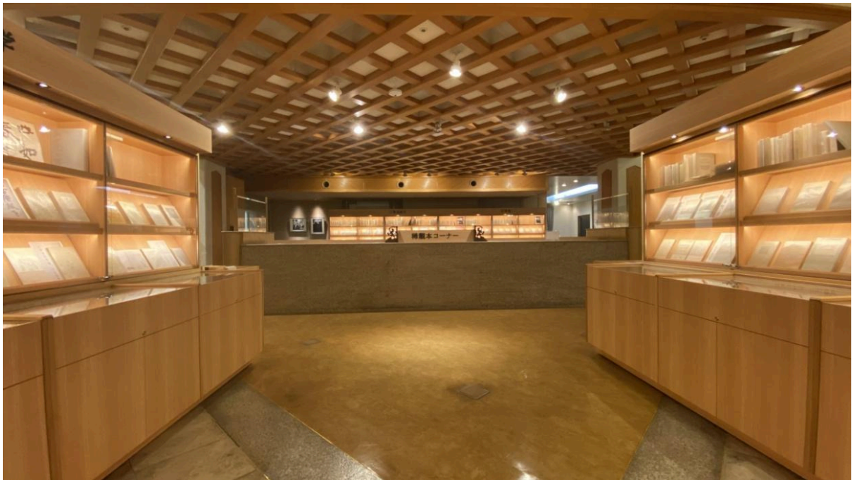
2024 年 11 月「伊香保文学館 -近代文学の歴史-」オープン

11月1日、群馬県渋川市の伊香保温泉ホテル天坊 館内に「伊香保文学館 -近代文学の歴史-」が開館します。明治以降の近代文学を代表する作家たちの貴重な初版本や署名本を中心に展示する、全国でも珍しい私設文学館です。