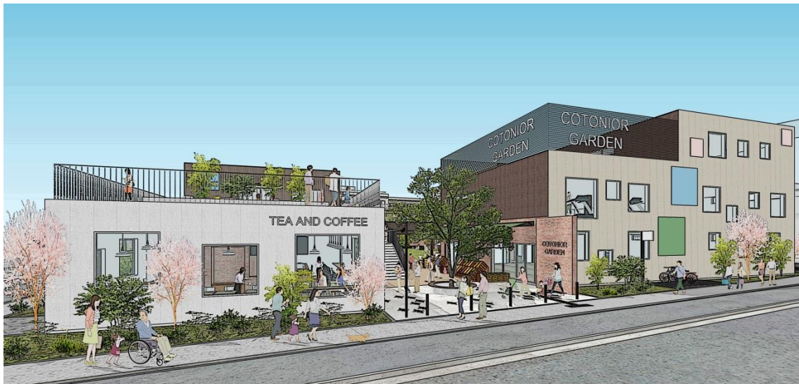
まちのエントランス