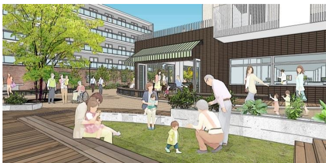
多世代交流の広場