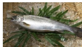
（「べっ嬢さくらます うらら」イメージ）

サクラマスはかつて富山県の名産品「ます寿司」に使われていましたが漁獲量が減った現代では希少な魚です。JR西日本と富山県射水市（いみずし）は産業振興による地域活性化を目指し、陸上養殖によりサクラマスを復活させました。安心して生で食べられ、柔らかい肉質に上品な脂がのった「べっ嬢さくらます うらら」を使用したメニューが東京駅に初登場します。