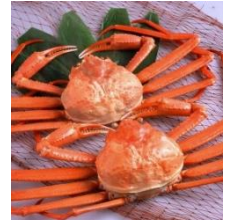
（「高志の紅ガニ」イメージ）

富山湾内で漁獲される紅ズワイガニは3,000m級の山々が連なる北アルプスから流れ出る良質な水や豊富なプランクトンで育つため、その味は格別です。「旨味」「甘味」ともに抜群であり、また、漁港から漁場までの距離が近く水揚げされたのちすぐに出荷されるため、とても新鮮なのが特徴です。