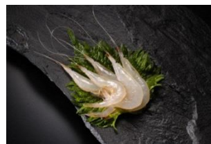
（シロエビ イメージ）

富山湾独特の海底谷「藍瓶（あいがめ）」に群泳するシロエビ。体長は約6センチと小粒で、水揚げ直後、透明感のある淡いピンク色をした姿から「富山湾の宝石」と称されます。漁として成り立つのは富山湾だけで、地元の漁業者の努力のもと資源管理を行いながら、大切に漁獲されています。