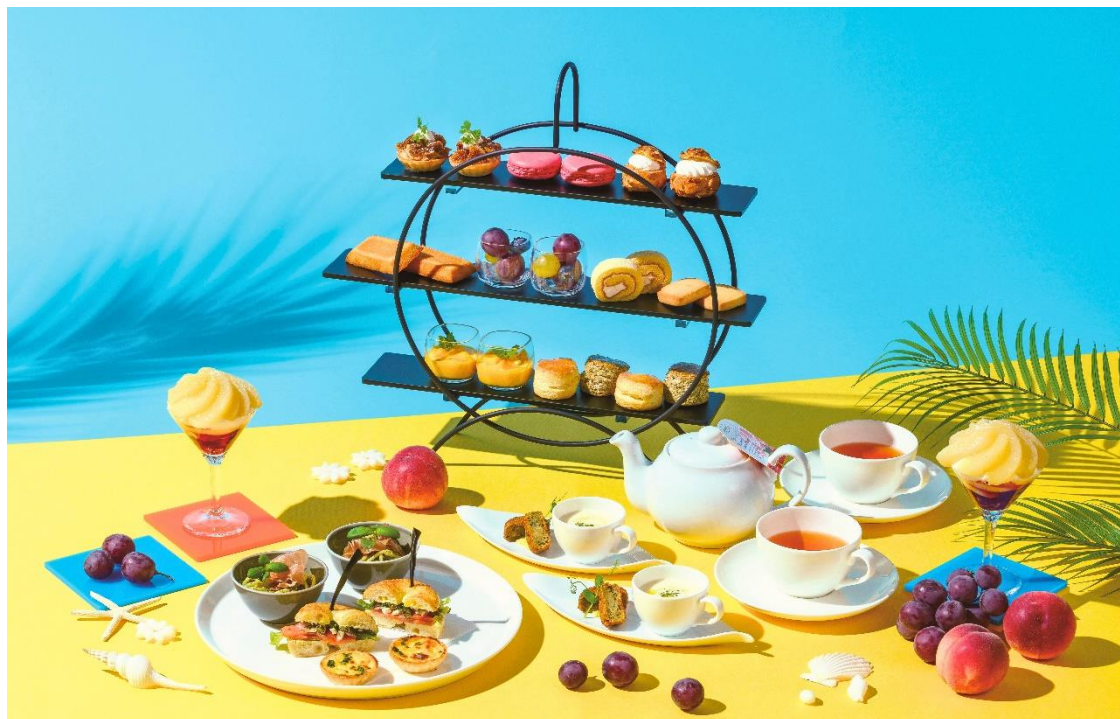
『サマーフルーツアフタヌーンティー』

また、先行して6月12日(水)より、同レストランのディナーをよりカジュアルにお楽しみいただけるよう、アラカルトメニューをバルスタイルにリニューアルいたします。