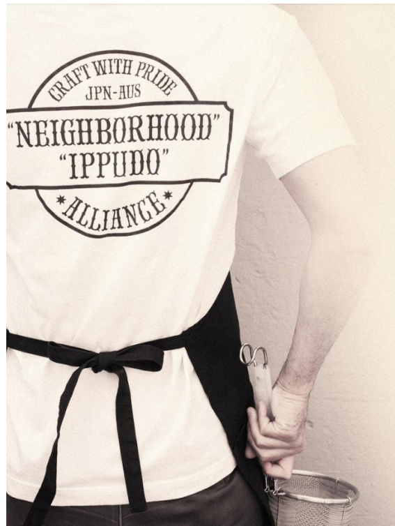
ヴィジュアル写真⑤