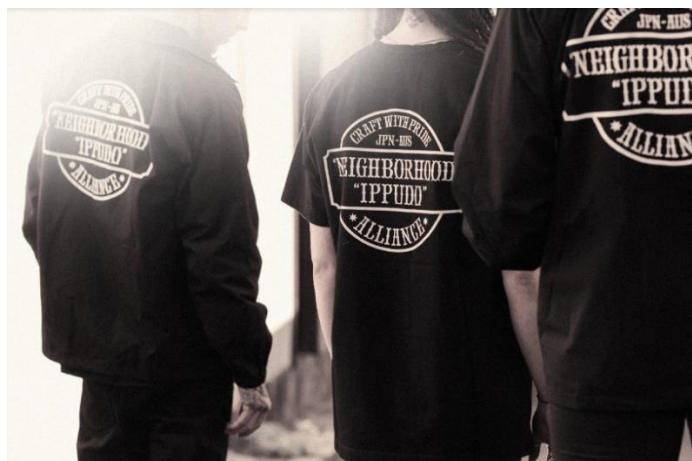
ヴィジュアル写真①

※オーストラリアにはミシュランガイドがなく、星の代わりにGood Food「シェフハット」という名目でランク付けして発表されます。