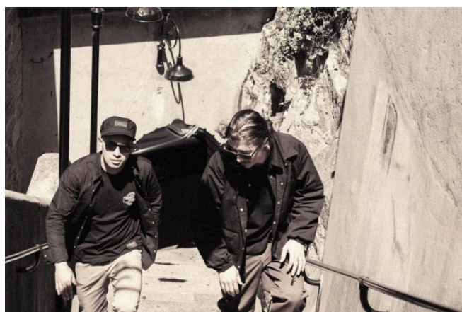
ヴィジュアル写真③