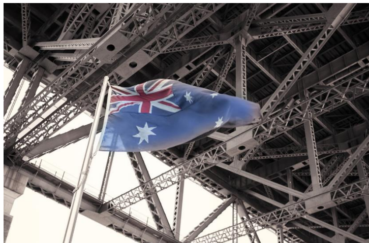
ヴィジュアル写真⑥