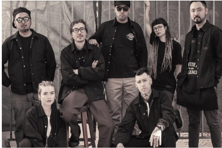
ヴィジュアル写真④