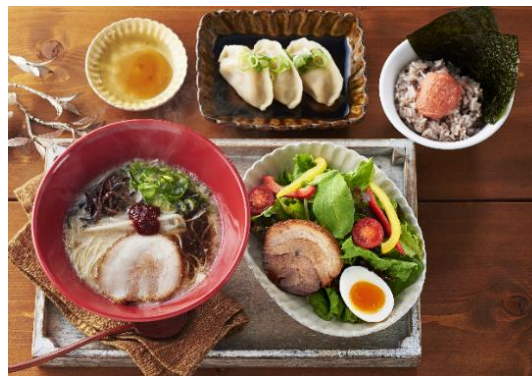
ラーメン+サイドメニュー3品セット 1,400円 小ぶりのラーメン1品と、サイドメニュー3品を選んで組み合わせることができます。