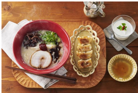
ラーメン+サイドメニュー2品セット 1,100円 小ぶりのラーメン1品と、サイドメニュー2品を選んで組み合わせることができます。