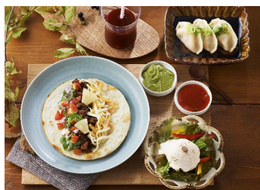
サイドメニュー3品セット 900円 サイドメニューの中から3品を選んで組み合わせることができます。