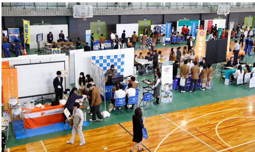
栃木県での「COURSEEXPO」開催の様子

本イベントには、県内外から約50社の企業が集結。従来の「座って話を聞く」だけの説明会とは異なり、生徒が実際に「見て・触れて・体験する」ことを通じて、仕事の魅力を直感的に感じられる、新しい試みです。