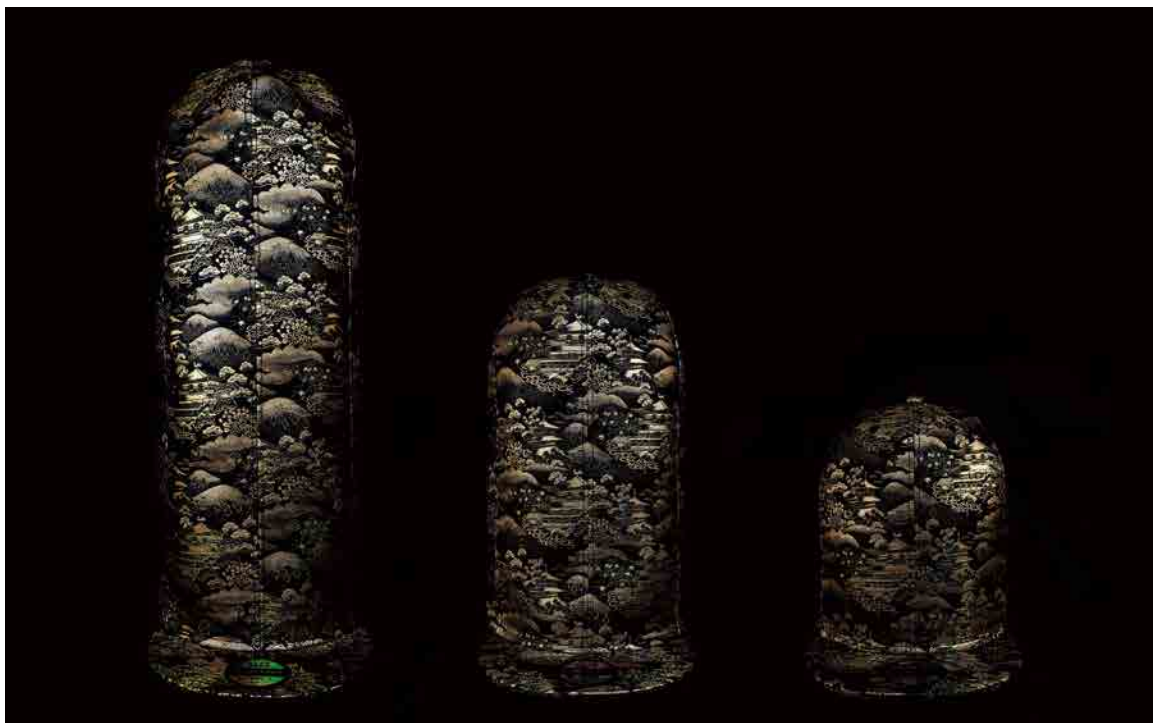
シリーズ名“EVOSHi”(写真は参考商品、ヴィンテージ着物生地を再使用)。使用生地、高さ、サイズ展開のカスタムオーダーが可能です。左より EVOSHi #001 (高さ約 53cm)、#002 (高さ約 35cm)、#003 (高さ約 23cm)、頭周りは全て約 56~62cm。※サイズはアジャスト機能他に XXL まで変更可能。

アートオブピース株式会社 ( https://www.artofpeace.tokyo ) は、この度、W@nder Fabric® 代表 TOSHHi による“日常にアート”をテーマとした唯一無二のアートキャップを発表し、あわせてカスタムメイドキャップの受注を開始いたします。