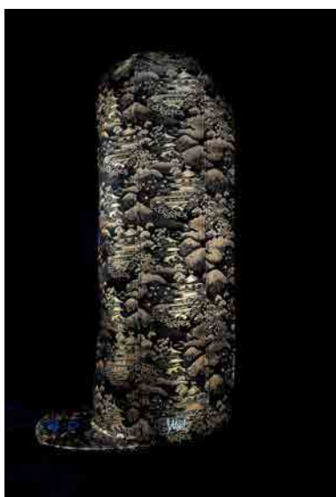
EVOSHi #001 (側面側)

アートキャップ概要： https://www.toshixxx.com/artcap