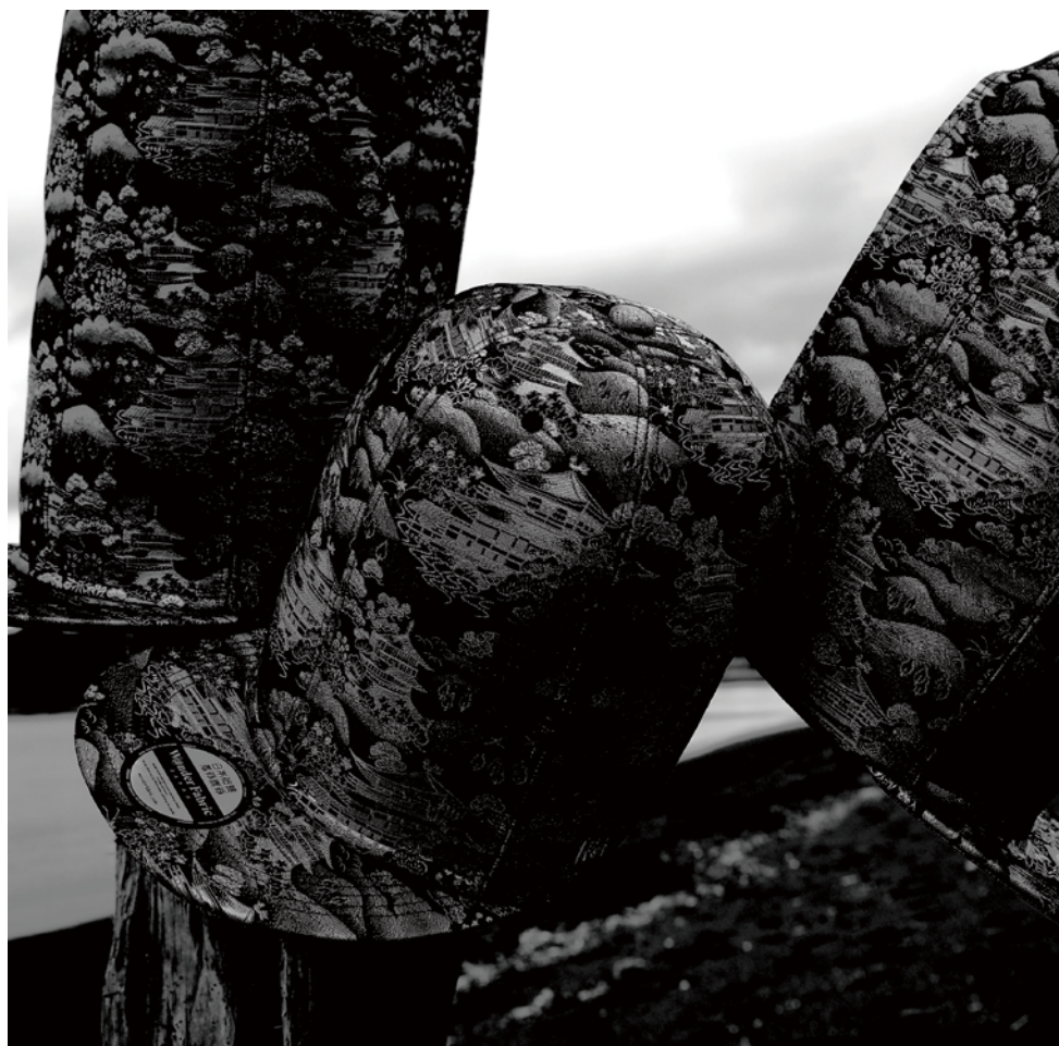
アートキャップキービジュアル

ヴィンテージ着物や生地をアップサイクルし、ラグジュアリーなキャップを生み出す W@nder Fabric® (ワンダーファブリック)。唯一無二のデザインで、キャップの新たな可能性を拓く。