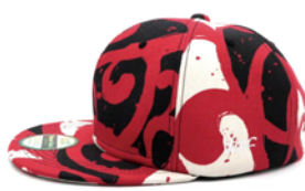
ALOHA CAP (ヴィンテージアロハシャツを解体した生地使用)