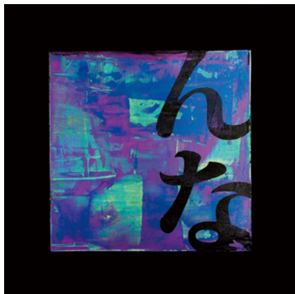
Abstract painting expression with "HIRAGANA" #Blue

アートグッズのご紹介へのリンク： https://www.toshixxx.com/all-view