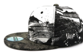
TANGO CHIRIMEN MIX CAP (京都丹後縮緬を使用)