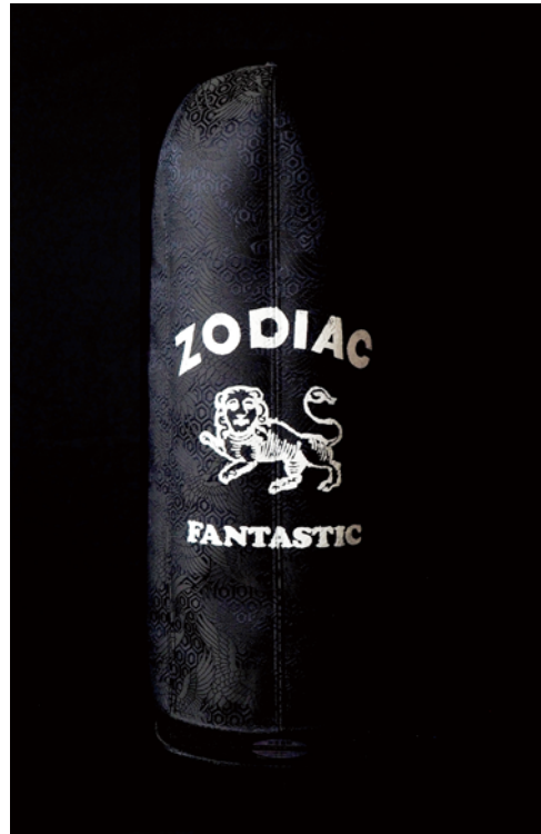
KIMONO ART CAP "ZODIAC" 高さ約 53cm、頭周り約 56～62cm (概ね M～L) 着物生地を再利用しシルクプリントで仕上げたモデル。