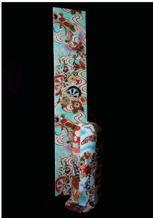
Kimono Fabric Art Panel & KIMONO ART CAP

■合わせて展開するアートグッズ類 ※販促、POPUP 時の告知などにご利用いただけます。 アートグッズのご紹介へのリンク： https://www.toshixxx.com/all-view