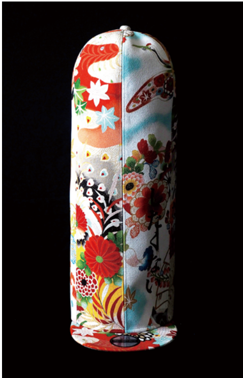
KIMONO ART CAP "HIRAGANA" 高さ約 53cm、頭周り約 56～62cm (概ね M～L) ヴィンテージ着物生地を再利用しシルクスクリーンプリントで仕上げたモデル。

アートキャップご紹介リンク： https://www.toshixxx.com/all-view