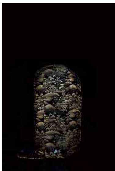
EVOSHi #002 (側面側)