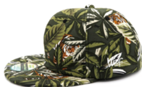
ALOHA CAP (ヴィンテージアロハシャツを解体した生地使用)

■販売中のキャップ (従来品) 掲載サイト : https://wonderfabric-store.com