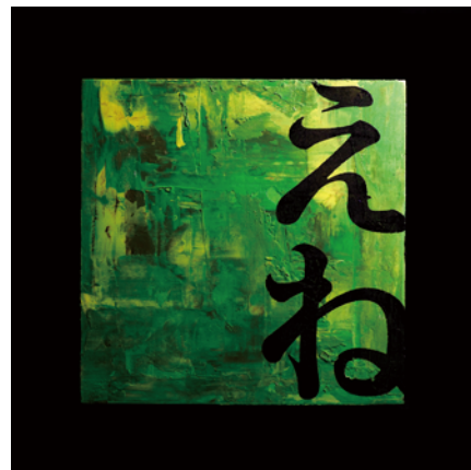
Abstract painting expression with "HIRAGANA" #Green