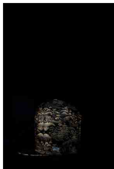
EVOSHi #003 (側面側)