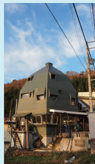
野沢温泉企画が運営するミュージックバー、GURUGURU