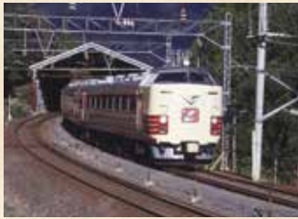
1988年 特急つばさ(個人蔵)