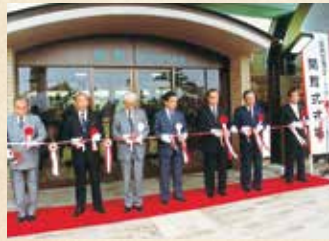
1991年 庄内空港ビル開館テープカット(山形県)