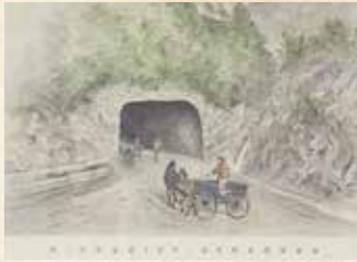
1884年 高橋由一 南置賜郡万世新道ノ栗子隧道西口ノ図(山形県立図書館蔵)