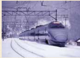
1993年 つばさ400系(個人蔵)