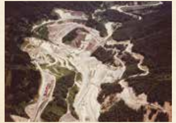
1981年 寒河江ダム工事(最上川ダム統合管理事務所)