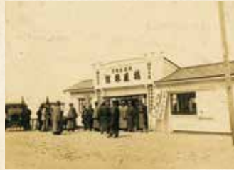
1920年代頃 あつみ温泉(あつみ観光協会)