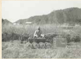
1973年 県庁地質調査(山形県)