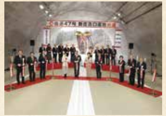
2024年 国道47号新庄古口道路開通式(山形河川国道事務所)