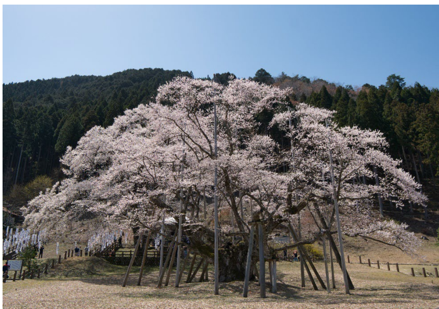
▲岐阜県根尾地域の淡墨桜

神戸メリケンパークオリエンタルホテルでは、今後も多くの方々にこのプロジェクトを知っていただくきっかけとして協力をしていきたいと考えています。