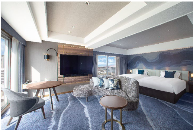
▲客室一例「エグゼクティブコーナーツイン」

館内には、神戸らしい風景を眺めながらお食事をお楽しみいただける4つのレストランをご用意。最上階に位置し、パノラマに広がる絶景夜景と共に銘酒が楽しめる「VIEW BAR」や、港らしい風景を眺めながら神戸ビーフをはじめとする美食をご堪能いただけるステーキハウス「オリエンタル」など、さまざまなご利用シーンで神戸らしい唯一無二のホテルステイをご提供いたします。