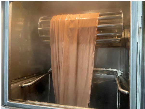
「株式会社艶金にて撮影」 ▲左：淡墨桜の枝 右：染色工程の一部