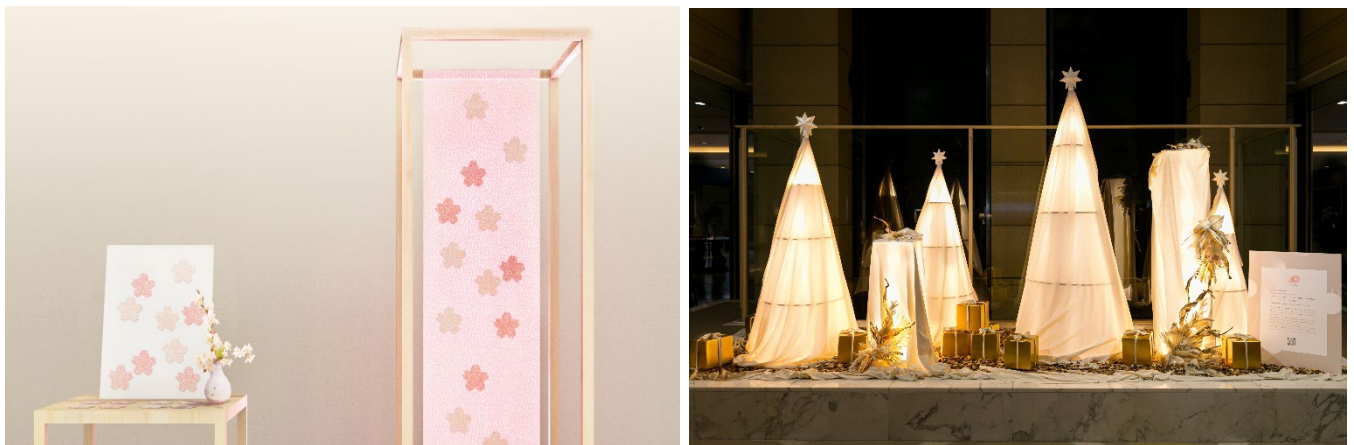
▲左：桜色コースターと展示イメージ 右：昨年のクリスマスディスプレイ

このディスプレイで使用した布地を材料に、*「のこり染」という新しい技法で染め、この布地をアップサイクルした桜コースターが完成いたしました。こちらを、桜開花予想時期に合わせて3月21日（木）より、ロビーに展示いたします。