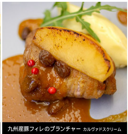
九州産豚フィレのブランチャール カルヴァドスクリーム