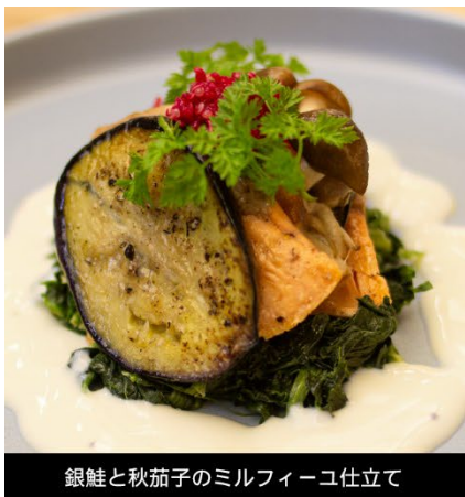
銀鮭と秋茄子のミルフィーユ仕立て