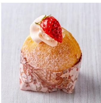
いちごのボンボローニ