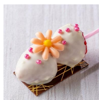
いちごのロリポップ