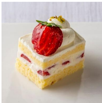
いちごのショートケーキ