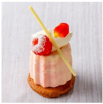
いちごのレアチーズケーキ