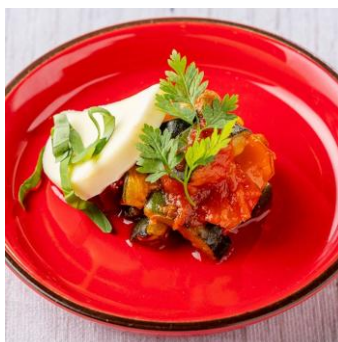
モッツアレラチーズとカポナー タのカプレーゼ風