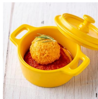
ポルチーニ茸のアランチャーニ (ライスコロツケ)