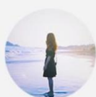
遠藤 明日香 @sherry_1113