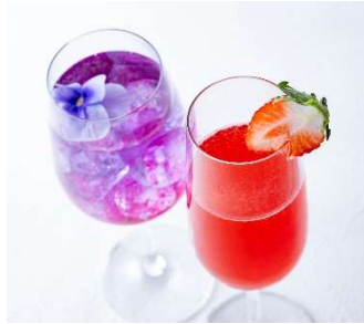
強運カクテル(ノンアルコール)、

TOWERカクテル 各¥1,000 (左より)東京タワーの赤と今年の強運カラーである青、紫を取り入れたカクテル。