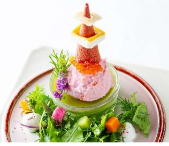
東京タワー朱色のポテトサラダとモッツアレラ ¥1,000