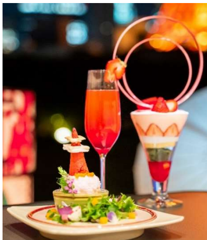
お食事からスイーツまでご用意