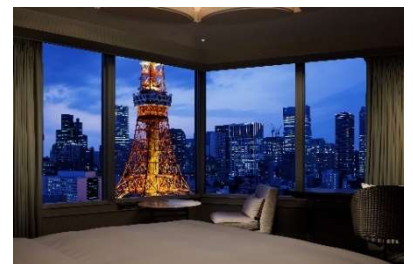
パノラミックコーナーキング(客室一例)