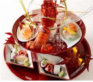
東京タワー見立て 伊勢海老(国産)と海の幸の盛り合わせ ¥12,000

東京タワーをイメージした伊勢海老(国産)を使用したお造りなどを豪華に盛り合わせました。