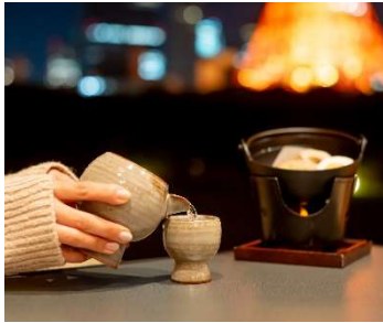
・おでん盛り合わせ ¥1,000

鮪かつサンド、海鮮タルト、蛤と筍のきんぴらの3種とともに、お酒をお楽しみいただけます。