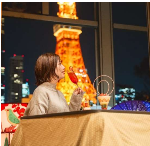
こたつに入って東京タワーを臨む絶景バー

(※)強運カラーは、ホテル近辺の芝大神宮が定めた各年のラッキーカラー。2024年は、男性は群青、天色、光白、女性は金、真紫、光白。