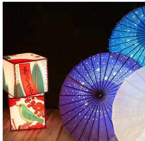
和傘や花札の装飾で和空間を演出、和傘のフォトスポットも庭園に設置