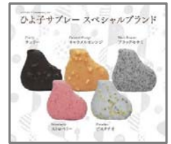
DOUX D'AMOUR (ドウ・ダムール)

オーストリア菓子職人の最高のパフォーマンスから生まれました。サクサクとした食感にバターの風味が香るサブレーはそのままに、ストロベリー、チェリー、キャラメルオレンジ、ブラックセサミ、ピスタチオの5種類のフレーバーをトッピングした逸品です。