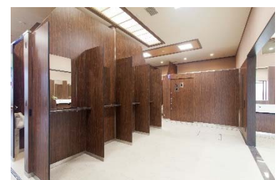
パウダールームのイメージ(美東SA)

(サブトイレ) 男性用) [小]:6基、[大]:6基 女性用) 16基 多目的) 1基