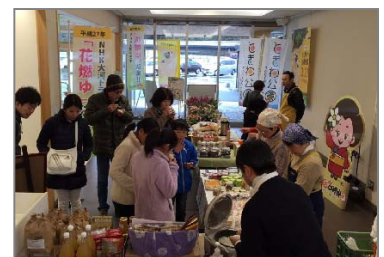
多目的スペースのイメージ(美東SA)