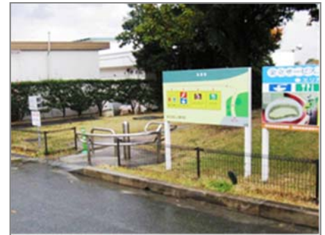
ウェルカムゲートのイメージ(金立SA)